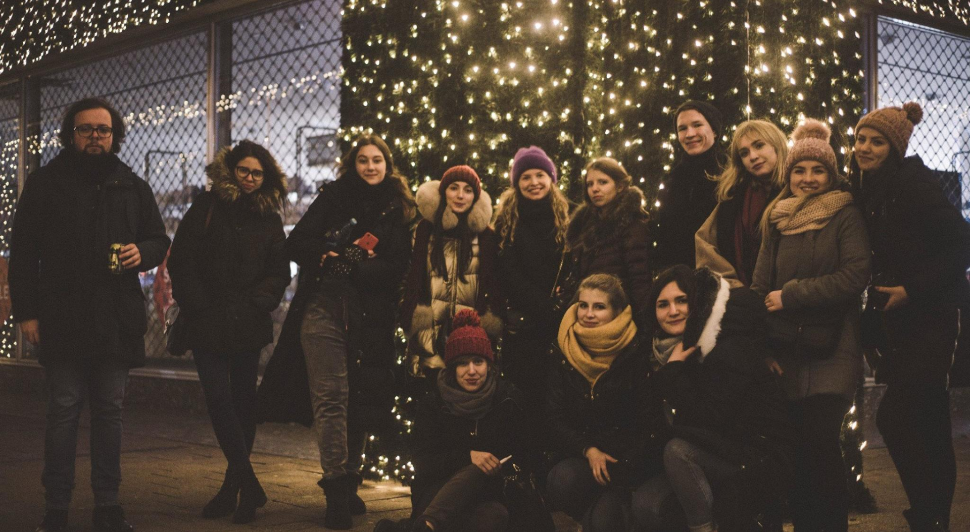
Druga grupa Service Learning: wizyta na uniwersytecie Erasma